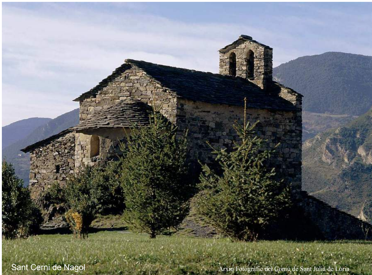
Sant Cerni de Nagol